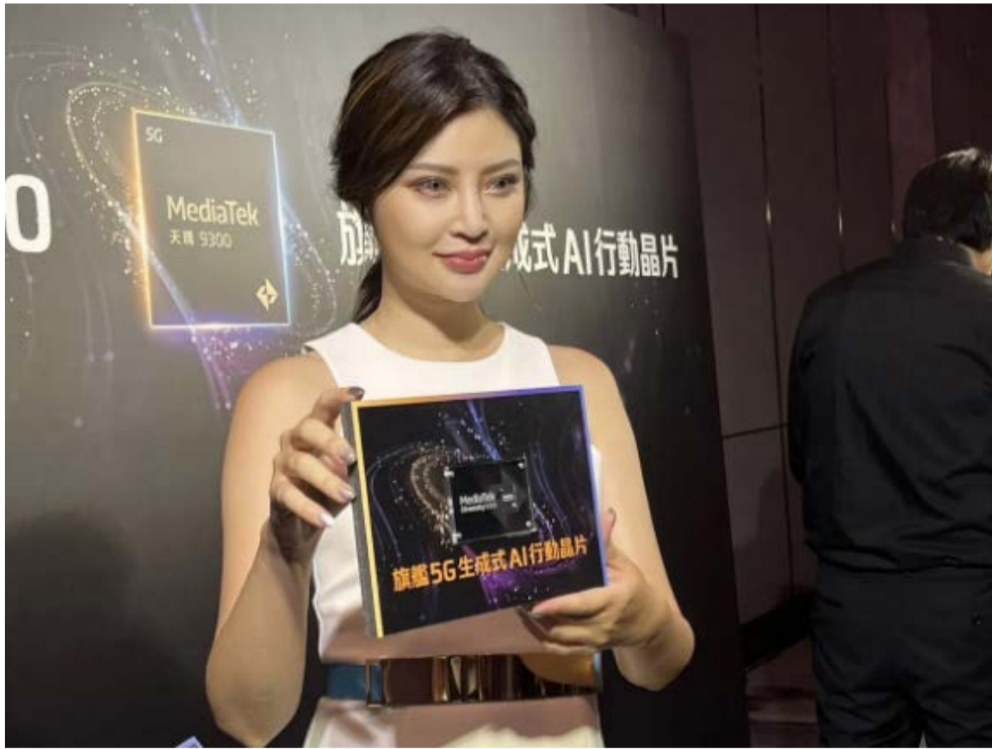
聯發科天璣 9300 旗艦晶片，將手機帶入 AI 時代。